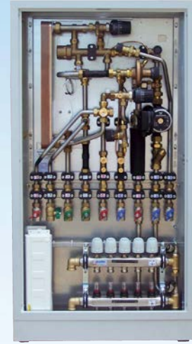
WH-WK Käyttövesi ja patteri- tai lattialämmitys