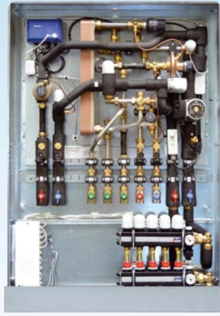
WH-WK-HK Käyttövesi, lattialämmitys ja viilennys