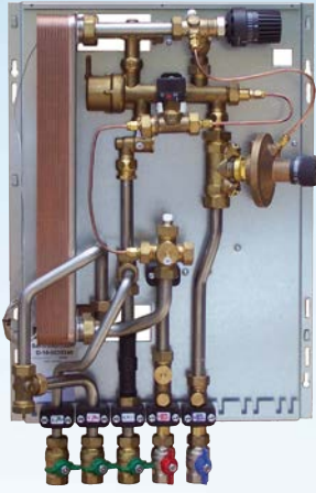
WH-TW Käyttöveden lämmitys